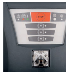
Alarm količine napolnjenosti zbirnika