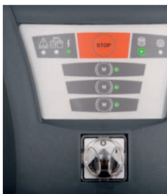
3 motorji v pripravljenosti