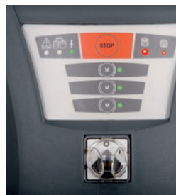
Glavni filter in absolutni filter zamašena