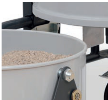
Regulacija polnosti zbirnika (SC)