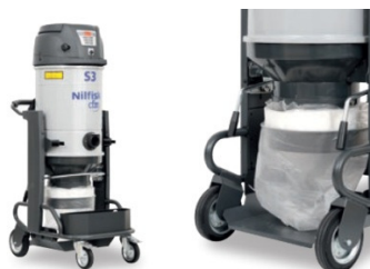
Model S3 z gravitacijskim praznjenjem v Longopac® vrečo

Zbirne posode: model S2 je na voljo z 40 l zbirno posodo model S3 pa z 50 l ali 100 l zbirno posodo. Oba modela sta na voljo tudi z zbirno vrečo ali Longopac® sistemom. Longopac® sistem omogoča zbiranje materiala v "neskončno" vrečo katero napolnimo do zelene količine odrežemo, zavržemo in takoj začnemo s sesanjem v novo vrečo.