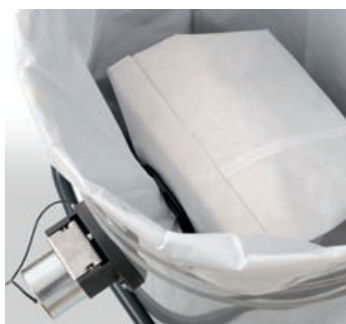
Varnostna vreča za nevaren material