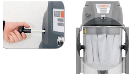
Ročno stresanje filtra

Sistem čiščenja filtra: dve izvedbi: standardni sistem z visoko učinkovitim ročnim stresanjem in izvedba z elektro stresanjem filtra.